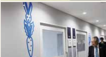
8階屋外庭園(上)と小児科病棟のホスピタルアート(下)

式終了後、岡学長、杉野病院長とともに、A棟8階小児科病棟及び1階オーデトリアムの施設見学を行いました。