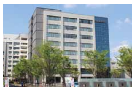
総合研究棟B 医明館(いめいかん)