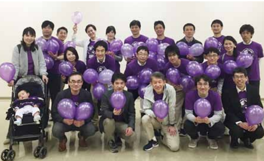
紫色のものを身につけて応援しよう