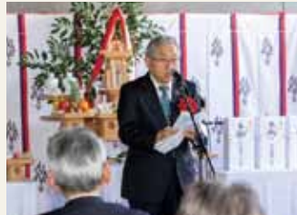
挨拶をする岡学長