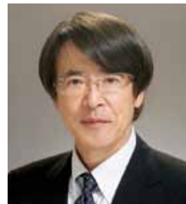
山口大学大学院医学系研究科 保健学専攻 病態検査学講座 教授

私が山口大学で過ごした22年の間に医学部の周りの道路など周囲の環境も大きく変わりました。大学自体も大学院化、法人化など幾つもの改革がありました。その時々々の学長、医学部長のもとで幾つかの改革にも関わらせていただきました。私自身は基礎医学に身を置いていたので、その影響は比較的少なかったかもしれません。今後、さらに法人複数大学制など新たな大学改革の波が押し寄せようとしています。山口大学医学部では、ちょうど新病棟や新しい講義室の入った医修館などが出来た時期であり、若い人を中心に大きな夢を持つて前に進んでいただきたいと思います。最後にありますが、山口大学医学部及び附属病院のますますの発展と皆様のご活躍を祈念し、退任のご挨拶とさせていただきます。