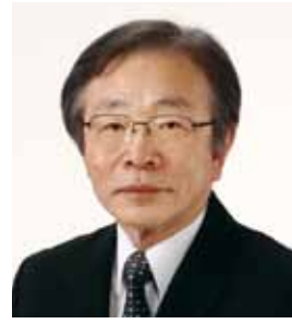
山口大学大学院医学系研究科 薬理学講座 教授