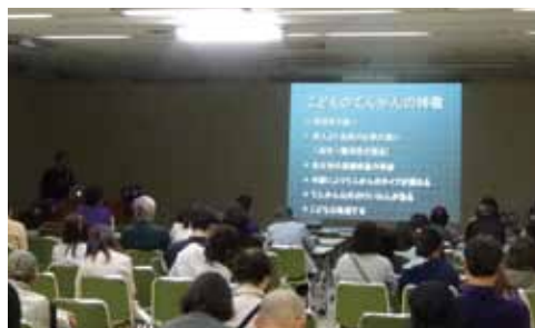
公開講座ではわかりやすく説明します

で、応援メッセージを伝えることができます。 山口大学てんかんセンターでは、このパープルデーにあわせて、みなさんに正しいてんかんの知識を身につけていただけるよう、てんかん市民公開講座を2年前から開催してまいりました。今年は宇部、下関の2か所で開催いたします。また、3月26日には両市数か所で紫色のライトアップを行います。 この機会に、みなさまにてんかんについて興味を持ち、正しい知識を身につけていただけますと幸いです。